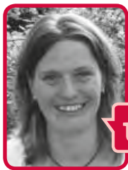
Ihr Udo Beckmann Landesvorsitzender

Eine hohe Wahlbeteiligung und eine deutliche VBE-Mehrheit in den Personalvertretungen zeigen der Landesregierung, dass Lehrerinnen und Lehrer bereit sind, für ihre Rechte einzutreten. Aufgrund der Postlaufzeit bitten wir Sie, Ihre Wahlunterlagen bis zum 30.05.08 zu versenden!